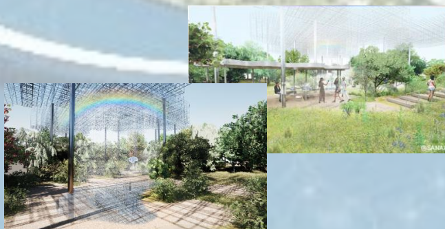
シグネチャーパビリオン「Better Co-Being」

屋根も壁もないパビリオン。季節や天候、時間帯によって変わる自然と、訪れた人々が響き合いながら「虹」を共に作るインスタレーションを始め、様々な共鳴を体感！