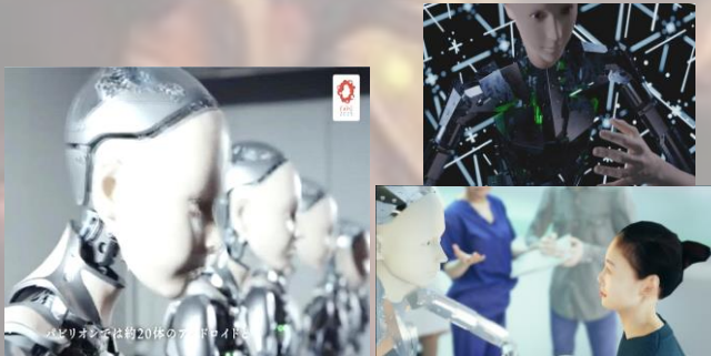
シグネチャーパビリオン「いのちの未来」

人間そっくりのアンドロイドは人間の可能性をどこまで拓げるのか？ 50年後のロボットに囲まれた未来の暮らしを体験。千年後の人間にも出会えるかも？！