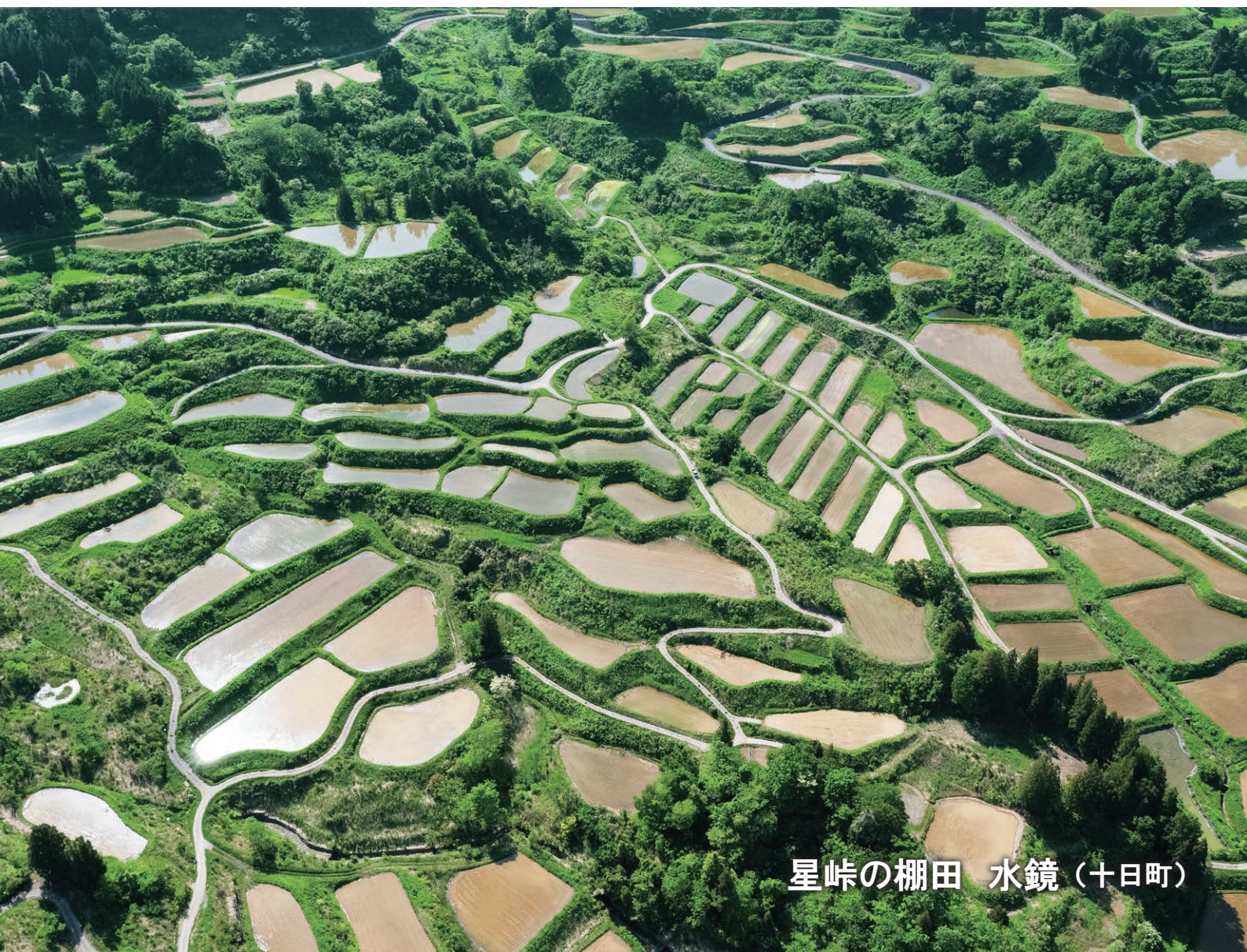
星峠の棚田 水鏡（十日町）