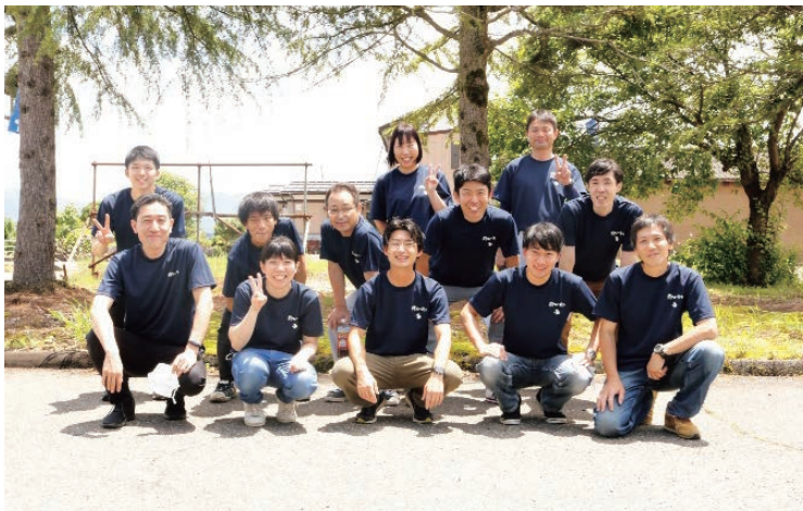
▲各セクションの職員一丸となってシステム開発に取り組みました。

ポータル画面を中心に、各サブシステムが一元化され、利用者は必要な業務ページに簡単にアクセスできます。さらに、マルチデバイス対応により、製造現場や事務所からリアルタイムで情報を確認・入力できる環境が整備されました。これにより、情報共有の漏れや転記ミスが防がれ、業務効率が大幅に向上しました。