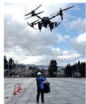
▲ドローンでの資材運搬の様子

「ドローンに興味はあるけれど、何から始めればいいのか分からない」という方も、機材の選定から、操作方法のサポートまで、一貫したサポート体制を整えておりますので、お気軽にご相談ください。問い合わせ・ご相談は、組合にご連絡をお願いします。