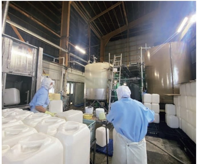
▲製造現場でタブレット使用することを想定

今後は、システムの運用を通じてさらなる改善を図り、DX推進計画を立案・実行することで、事業成長と従業員・組合員の満足度向上を目指します。